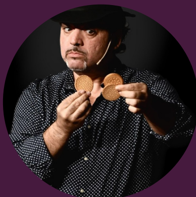
JUAN LUIS RUBIALES